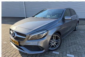
2e Pinksterdag open