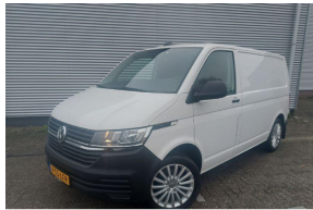
2e Pinksterdag open